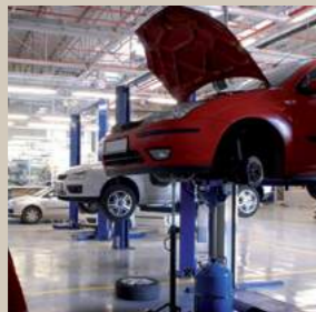
Auto - Moto