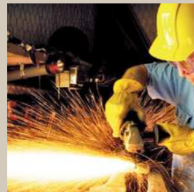
Travail des métaux