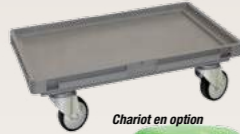
Chariot en option